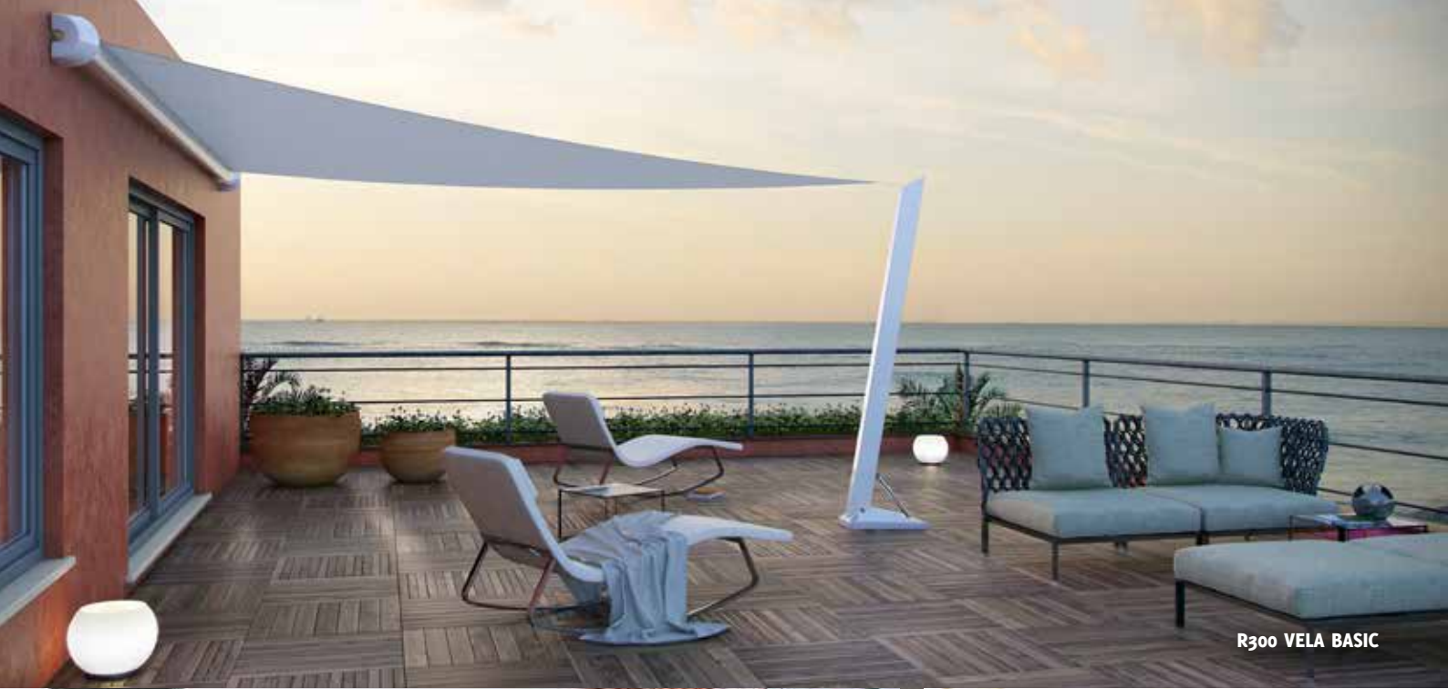
R300 VELA BASIC